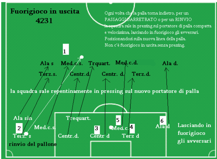
Illustrazione: fuorigioco in uscita

Il fuorigioco può essere “Statico”: Cioè si lasciano andare in fuorigioco da soli gli avversari che attaccano lo spazio prima del passaggio della palla. Oppure “in uscita”: Cioè ogni volta che il pallone “torna indietro”, per un passaggio arretrato o un rinvio della nostra squadra, la squadra sale portando il pressing sul portatore di palla avversario. E la nuova linea difensiva si pone sulla linea nella quale si trova il pallone.