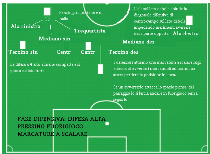
Illustrazione: Fase difensiva 4231

gonale col terzino sul lato debole, oppure verticalizzare per il taglio dell'Ala.