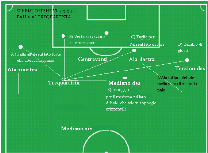
Illustrazione: schemi offensivi 4231