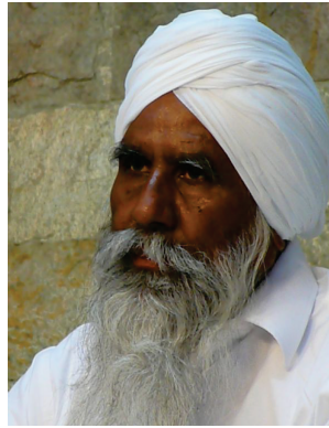
Sant Sadharam Ji