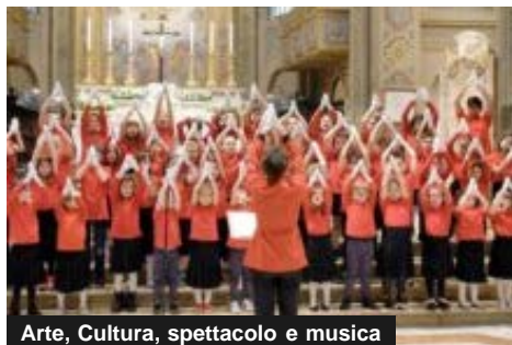
Arte, Cultura, spettacolo e musica

Il coro Voci e Mani Bianche dell'Istituto Figlie della Provvidenza canterà a Roma e incontrerà il Papa