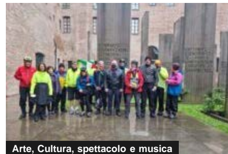
Arte, Cultura, spettacolo e musica

Omaggio del Vecchi-Tonelli al compositore Olivier Messiaen