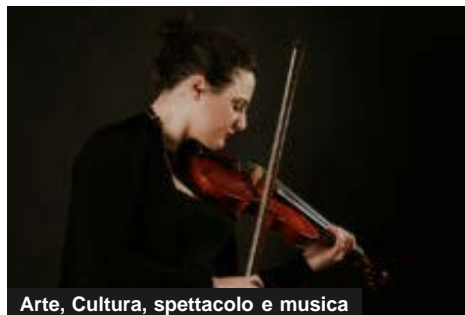
Arte, Cultura, spettacolo e musica

Il coro Voci e Mani Bianche dell'Istituto Figlie della Provvidenza canterà a Roma e incontrerà il Papa