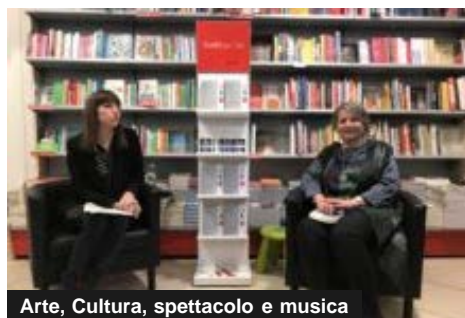
Arte, Cultura, spettacolo e musica

'Dal violoncello al canto' stasera in Auditorium San Rocco