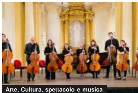
Arte, Cultura, spettacolo e musica

E' passata per Carpi e Fossoli la pedalata Fiab della Resistenza